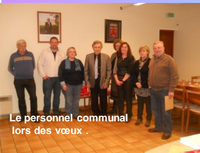
Le personnel communal lors des vœux .

Le projet Salle polyvalente est momentanément suspendu pour des raisons techniques. Tous les terrains du lotissement de la Résidence des Fontaines sont vendus et quelques maisons sont en construction; démarrage également des travaux de la résidence locative « SEMINOR »