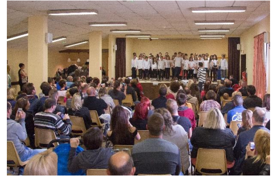
Fête de l'école le 18 juin

L'organisation reste inchangée pour la rentrée. Le mardi après-midi pour Lanquetot et le jeudi après-midi pour Bolleville. Une participation des familles sera demandée (50 € par enfant puis 40 € à partir du troisième.)